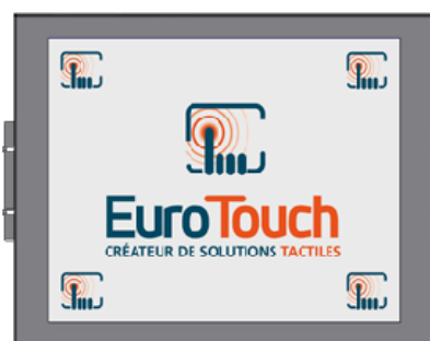
Version Panel Mount (PM)