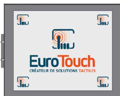
Version Panel Mount (PM)