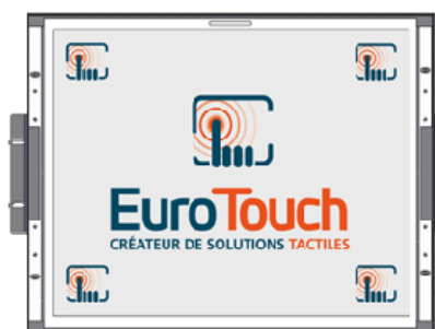
Version Open Frame (RM)