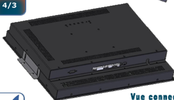
Vue connectique Fixation par équerres ou fixation murale VESA 100