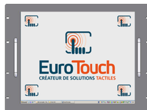
Version Rackable (19", 8U)[RK]