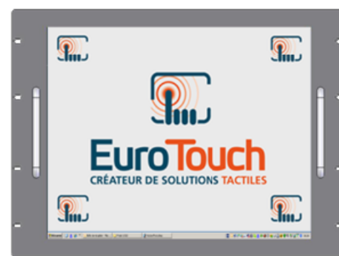
Version Rackable (19", 8U)[RK]