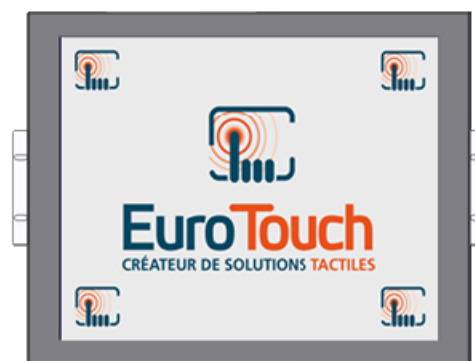
Version Panel Mount [PM]