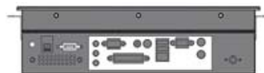
THOR 12P-PM vue connectique