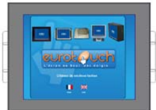
THOR 12P-PM vue face