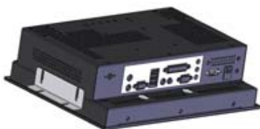
THOR 12P-PM vue arrière 3/4