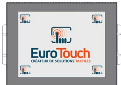
Version Panel Mount [PM]

Le Panel PC THOR de EuroTouch, s'adapte à tous les environnements : en Pupitre, dans une armoire électrique ou fixé à un bras grâce à sa fixation VESA 75. Son boîtier métal de dimension (L) 302 x (H) 226,2 x (P) 86,7 [mm] est doté d'un écran 12"1 SVGA (800x600) d'une luminosité de 450 cd/m 2 ou en option d'un écran 12"1 LED XGA (1024x768) d'une luminosité de 500 cd/m 2 . Avec ses nombreuses options le panel PC série THOR bénéficie des toutes dernières technologies.