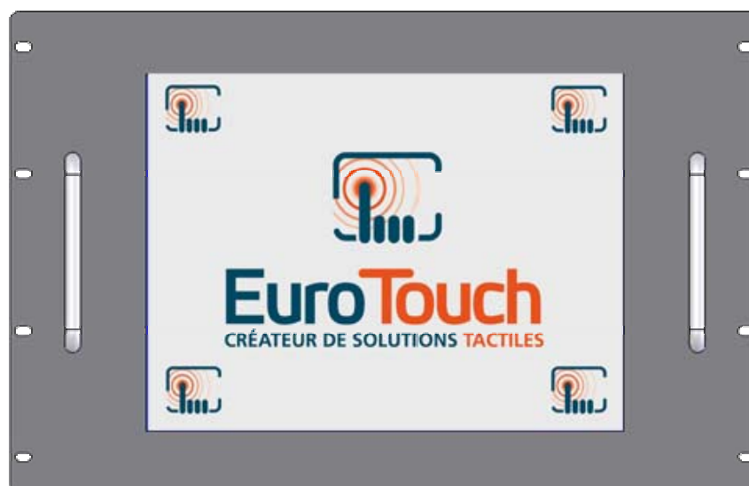
Rackable 7U 19"