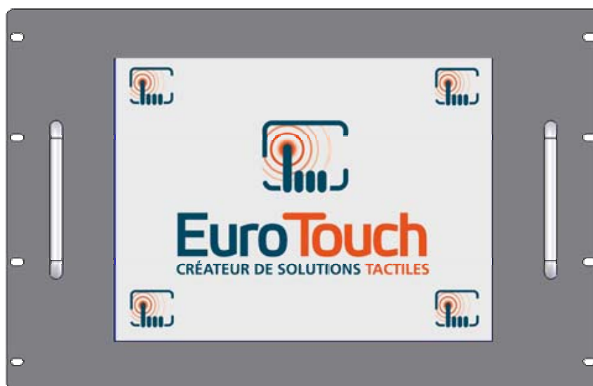
Rackable 7U 19"