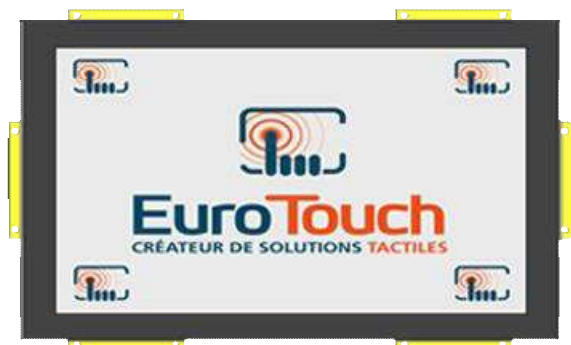
Version Panel Mount [PM]