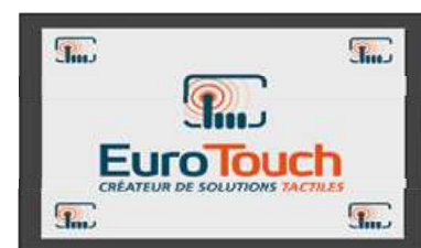
Version Coffret [BX]